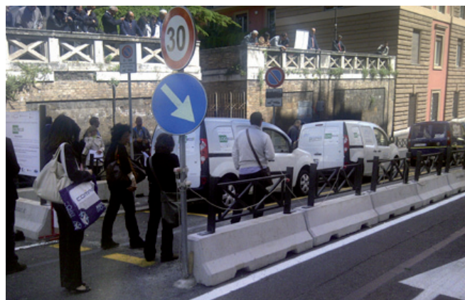
La sperimentazione del transit-point in LOGECO

Il progetto SMARTSET è perfettamente in linea con le esigenze di investire nella mobilità sostenibile a Roma, sia per il raggiungimento degli obiettivi di riduzione dei consumi sia per il miglioramento della qualità dell'aria e di recupero di aree per la ciclabilità e la pedonalità. Tramite i già avviati Tavoli di Lavoro con le associazioni di categoria e degli stakeholders del settore si stanno condividendo le scelte per ridurre gli impatti ambientali della distribuzione delle merci. Roma sta già valutando come rendere disponibili, in aree centrali e semicentrali, spazi da adibire a CDU.